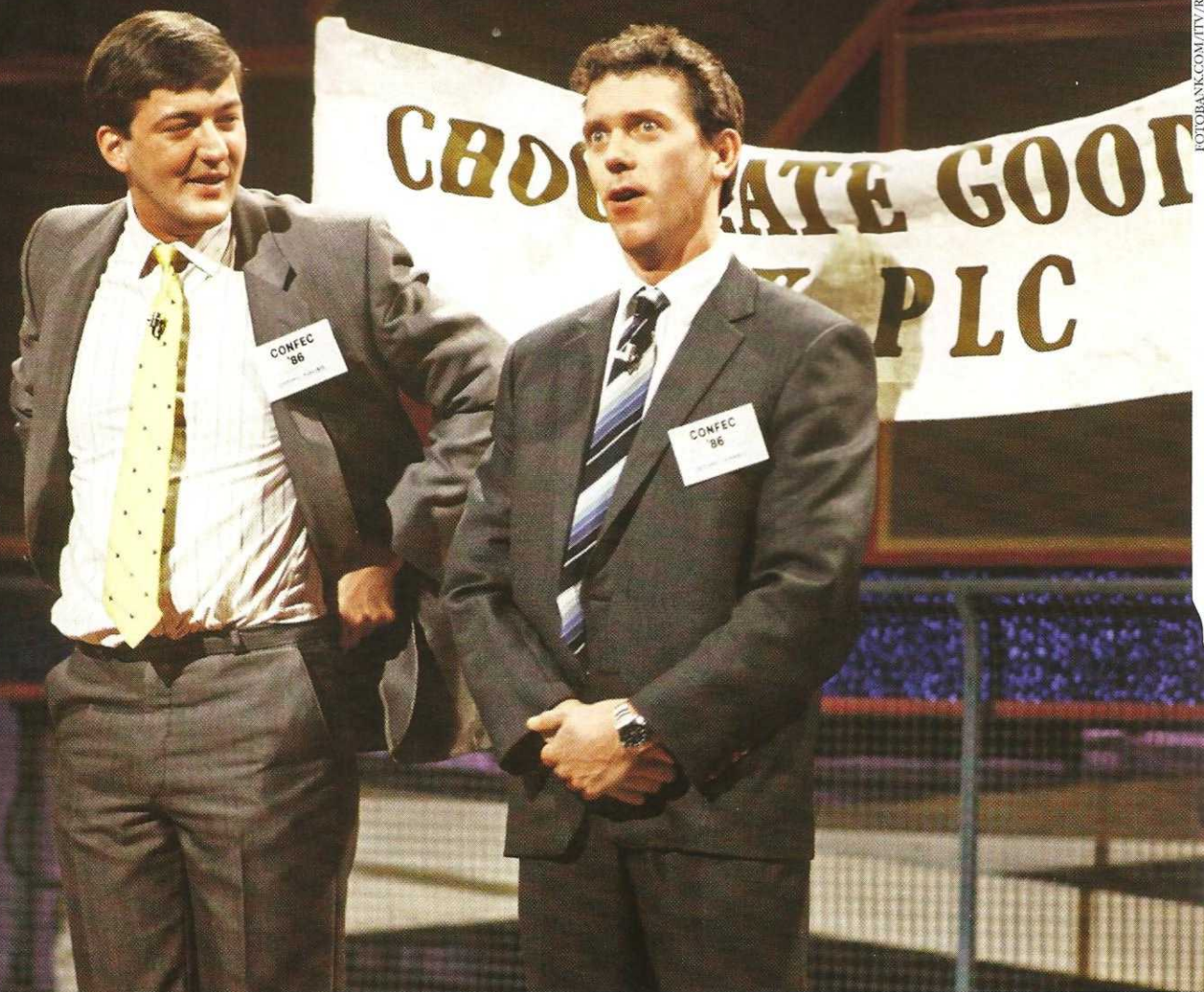
В Кембридже Лори познакомился с начинающим писателем и актером Стивеном Фраем. Никто не умел так пародировать обывателей, как тощий выюн Хью и упитанный флегматик Фрай

не полюбил бы женщину, которая сидит на одной водичке. Это несексуально. Хороший аппетит выдает широту и страстность натуры. Все его подруги обожали покушать, а тоненькая тростинка Эмма Томпсон в порыве страсти запросто могла умять целого цыпленка, не говоря уже о паре-тройке больших порций картошки из «Макдоналдса».